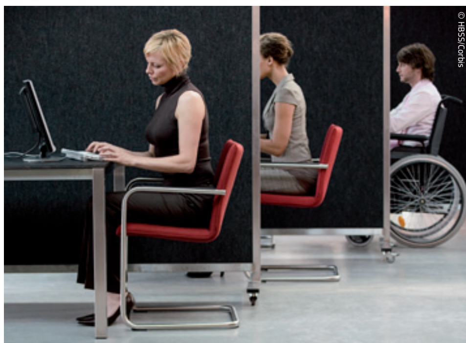
Sud EU-a osigurava potpuno poštovanje europskog zakonodavstva. Potvrdio je npr. zabranu diskriminacije radnika s invaliditetom.

Komisija u izvršavanju svojih ovlasti ima značajan stupanj neovisnosti. Njezin je posao zagovarati zajedničke interese, što znači da ne smije primati upute od vlade bilo koje od država članica. Ona kao „čuvar Ugovora” mora osigurati da se uredbe i direktive koje donose Vijeće i Parlament provode u državama članicama. U protivnom, Komisija može stranu koja počini prekršaj poslati na Sud Europske unije kako bi je prisilila da postupi u skladu sa zakonima EU-a.