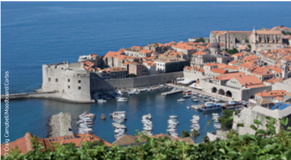
„Biser Jadrana“ – Dubrovnik u Hrvatskoj, najnovijoj državi članici EU-a.