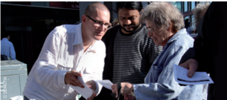
Demokratska Europa: zahvaljujući Ugovoru iz Lisabona, europski građani sada mogu predlagati nove zakone.

Europsko vijeće utvrđuje ciljeve EU-a i smjer njihovog ostvarivanja. Osigurava poticaje na glavne političke inicijative EU-a i donosi odluke o spornim pitanjima o kojima se Vijeće ministara nije uspjelo dogovoriti. Europsko vijeće također se bavi tekućim međunarodnim problemima putem „zajedničke vanjske i sigurnosne politike” – koja predstavlja mehanizam za koordinaciju stranih politika država članica EU-a.