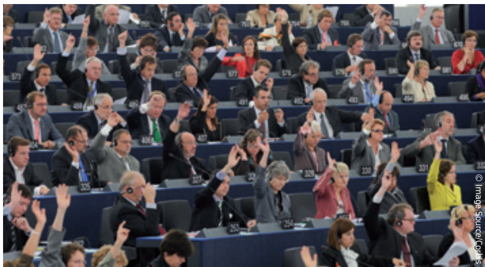
U Europskom parlamentu može se čuti vaš glas.

U 2011. je za predsjednika Parlamenta izabran Nijemac, Martin Schultz (Progresivni savez socijalista i demokrata).