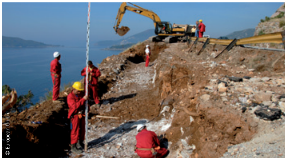
EU osigurava financijsku pomoć za izgradnju gospodarstva u susjednim državama.

Financijskom pomoći EU-a objema skupinama upravlja se u okviru Instrumenta za europsko susjedstvo i partnerstvo (ENPI).