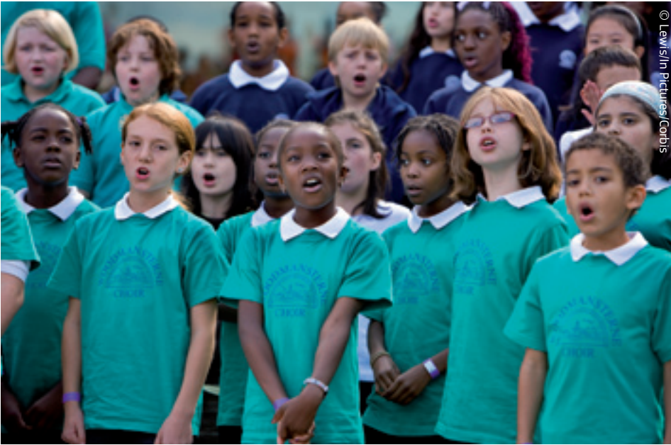
Ujedinjeni u raznolikosti: zajedno ostvarujemo bolje rezultate.

U današnjem su svijetu ekonomije u porastu kao što su Kina, Indija i Brazil odlučne pridružiti se Sjedinjenim Državama kao globalne supersile. Stoga je važnije nego ikad da se države članice Europske unije ujedine i ostvare „kritičnu masu” tako održavajući svoj utjecaj na svjetskoj sceni.